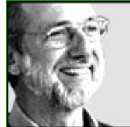
Renzo Piano, architecte